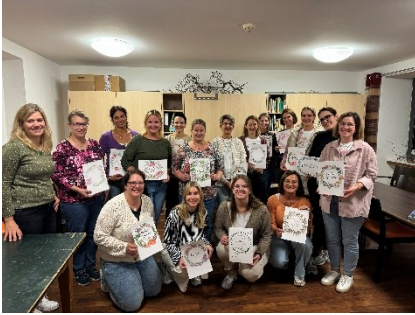
Foto: Teilnehmer Frauenbund-Malkurs