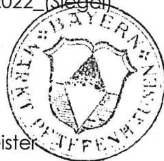
Thomas Leinauer, Erster Bürgermeister

An die Amtstafel geheftet am: 28.10.2022